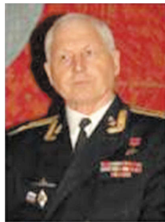
Краеведческий музей Бабынинского района.

За большой вклад в дело повышения обороноспособности нашей Родины, за героизм и самоотверженность, проявленные при выполнении специального задания, большую плодотворную работу по нравственному и патриотическому воспитанию молодого поколения ему присвоено звание «Почетный гражданин муниципального района «Бабынинский район»».